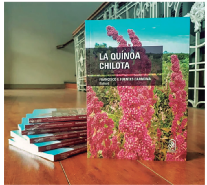
Libro "La quinoa chilota", Ediciones UC.

En esa línea, la profesional indica además que "se generarán alianzas estra-