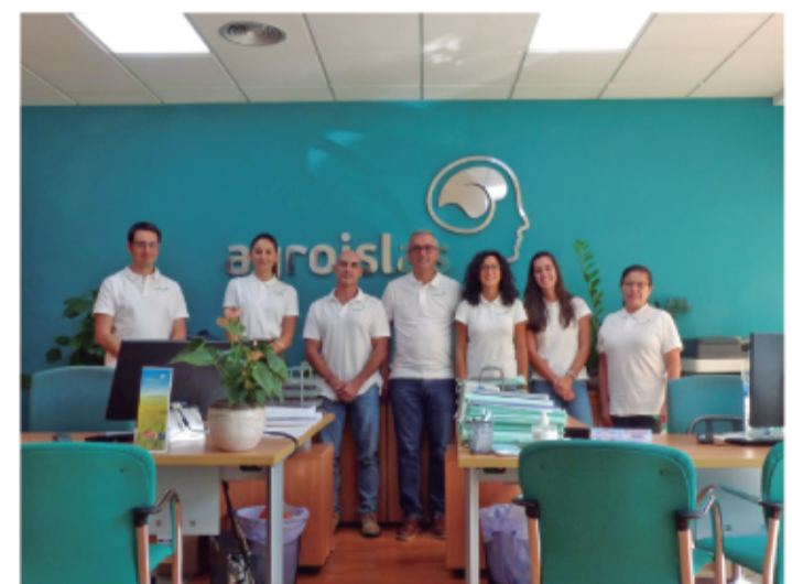
EQUIPO DE AGROISLAS - Islas Canarias - España.

El cambio climático es presenta como una larga sombra en nuestro futuro agrícola: subida del nivel del mar que destrozará tierras agrícolas, incremento de plagas y enfermedades vegetales, escasez de agua, deterioro del suelo, aumento de las temperaturas globales... Todo ello se constituye como una grave amenaza para nuestra agricultura y sobre la posibilidad de extraer alimentos de nuestras tierras. Aún así, podemos y debemos lanzar un mensaje de esperanza al mundo. Estamos a tiempo de parar este cambio y dejar un futuro próspero y sostenible para las generaciones venideras. Para ello, debemos practicar y fomentar buenos métodos agrarios, incrementar la materia orgánica en nuestros suelos, aumentar la biodiversidad, acudir a medios productivos agroecológicos, usar controladores biológicos para las plagas, estimular el comercio de productos agrícola-