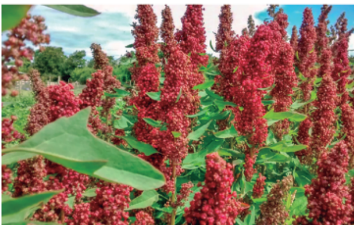
Cultivo de quínoa chilota en campos de Ancud.

A partir de este estudio se ha publicado recientemente el libro “La Quínoa Chilota”, con el objetivo de desarrollar una línea de base