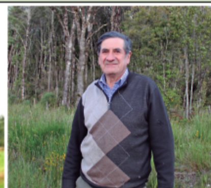
Nuevos desafíos para la Apach en el 2021.